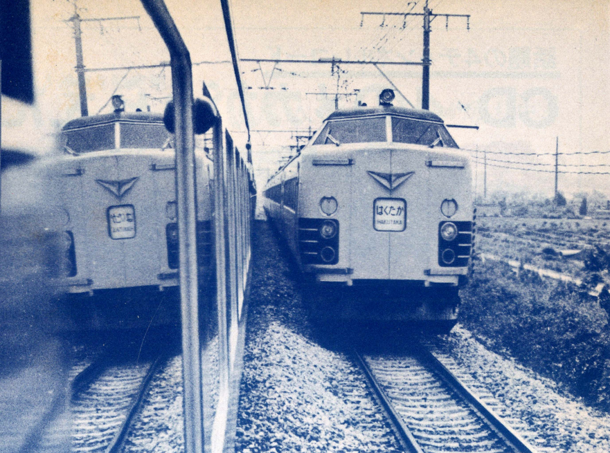
上り〈あさま1号〉と下り〈はくたか〉の出会い