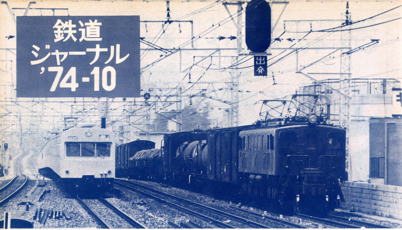
中央本線・高円寺駅付近で並走するEF15と101系