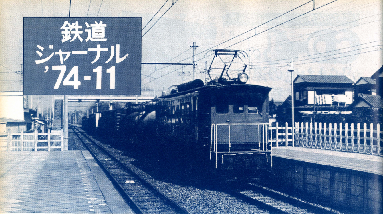
西武鉄道のE51形(もと国鉄のED12形)